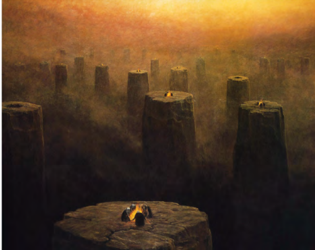
Obraz Zdzisława Beksińskiego z 1975 roku (bez tytułu)