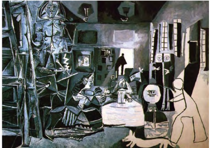
Pablo Picasso, Las Meninas, 1975