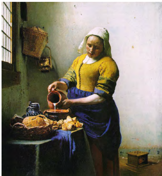
Johannes Vermeer, The Milkmaid , c.1660