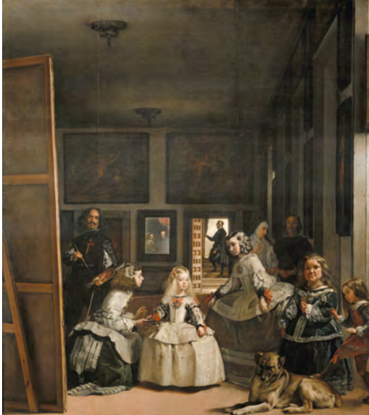
Diego Velázquez, The maids of honour (c. 1656)